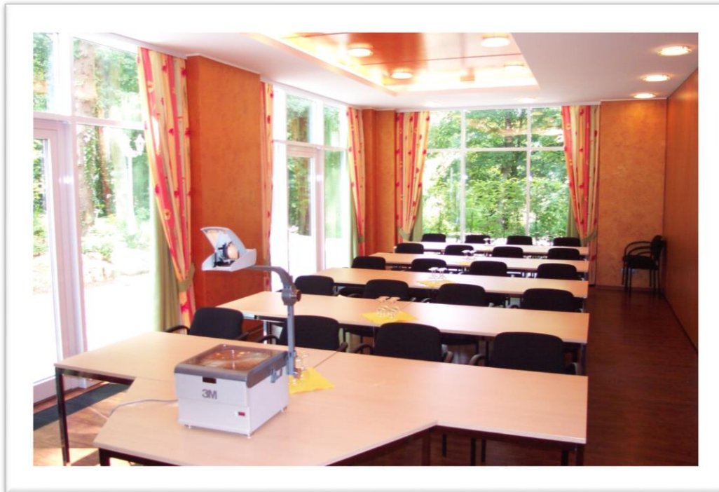
Raum Champagne (klimatisiert)

Die Tagungsräume verfügen alle über Tageslicht. Die Räume im Anbau sind vollständig abzdunkeln. Modernste Tagungstechnik wie Overhead-Projektor, Leinwand, Flipchart, Rednerpult, Telefon, Metaplanwand, Fernseher und Beamer stehen Ihnen in jedem Raum zur Verfügung.