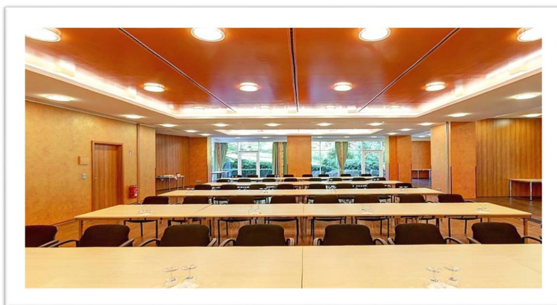
Raum Margaux und Champagne (klimatisiert)