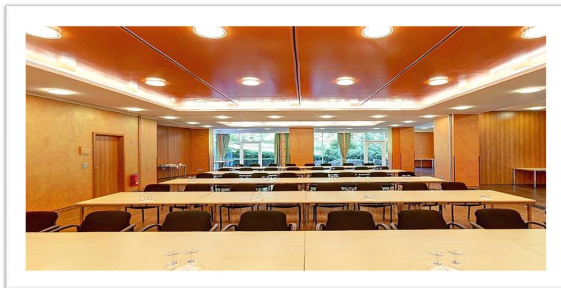
Raum Margaux und Champagne (klimatisiert)